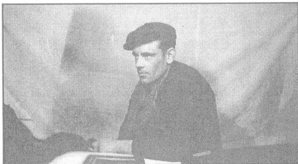
Knygos autorius 1955 metais lageryje.