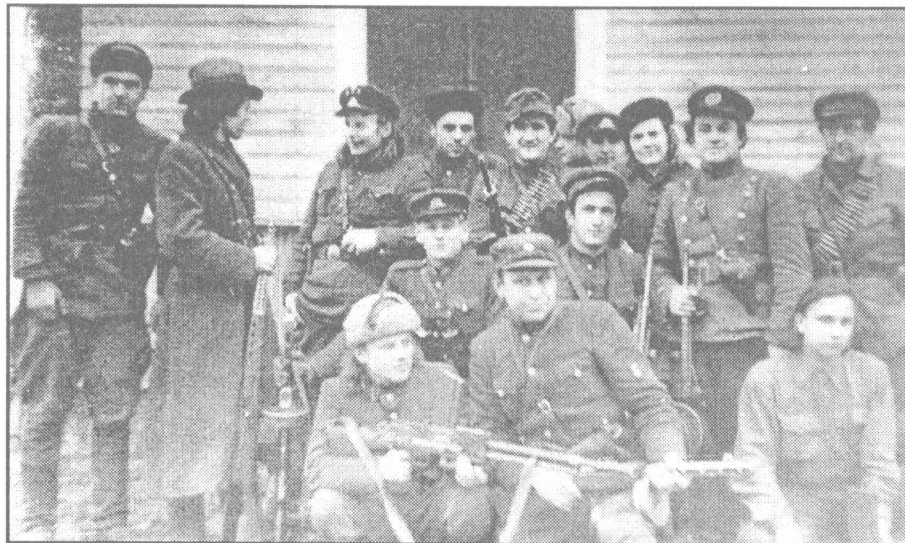
VTIES apygardos Šarūno būrio partizanai, žuvę įvairiu laikotarpiu.