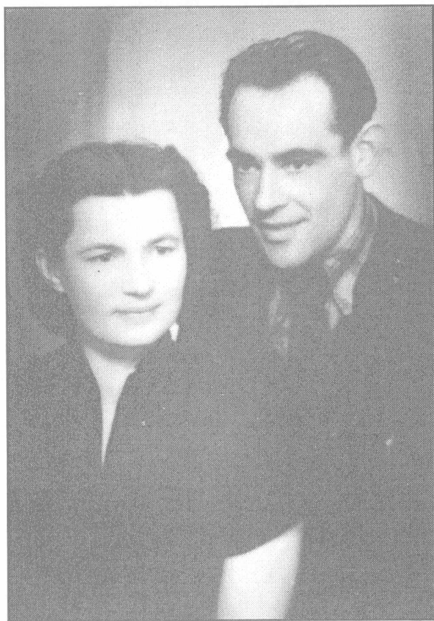
Knygos autorius su žmona Juze Lietuvoje 1957 metais.