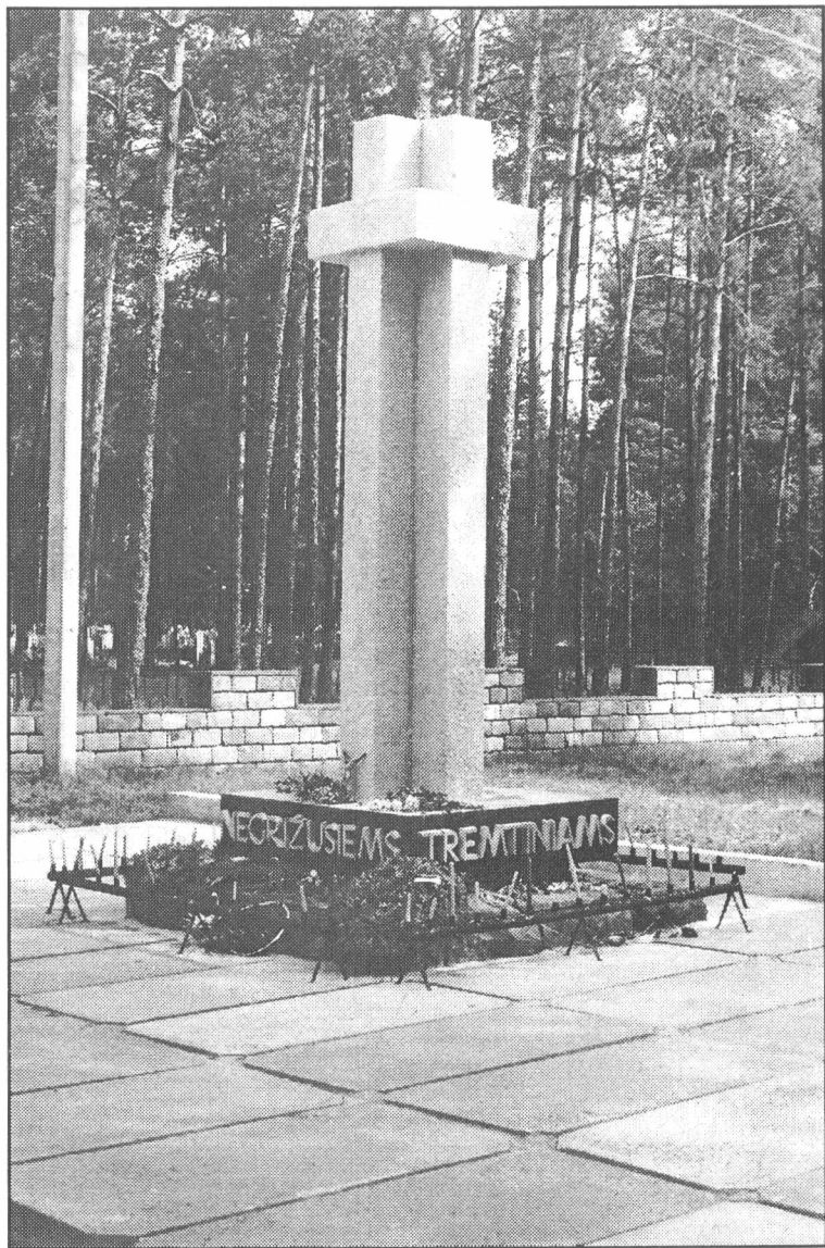
Paminklas negrįžusiems tremtiniams ir politiniams kaliniams prie Dukstynos kapinių Ukmergėje