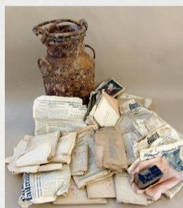
Prisikėlimo apygardos archyvas, 2004 m. rastas Miknių sodyboje