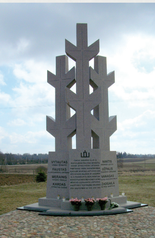
2010 m. pastatytas paminklas 1949 m. vasario 16 d. paskelbtai LLKS Tarybos Deklaracijai ir jos signatarams atminti. Skulpt. Jonas Jagėla