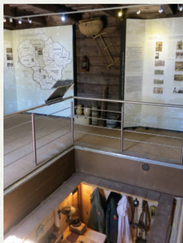
Miknių sodyboje atstatyto partizanų bunkerio ir 2012 m. įrengtos ekspozicijos fragmentas