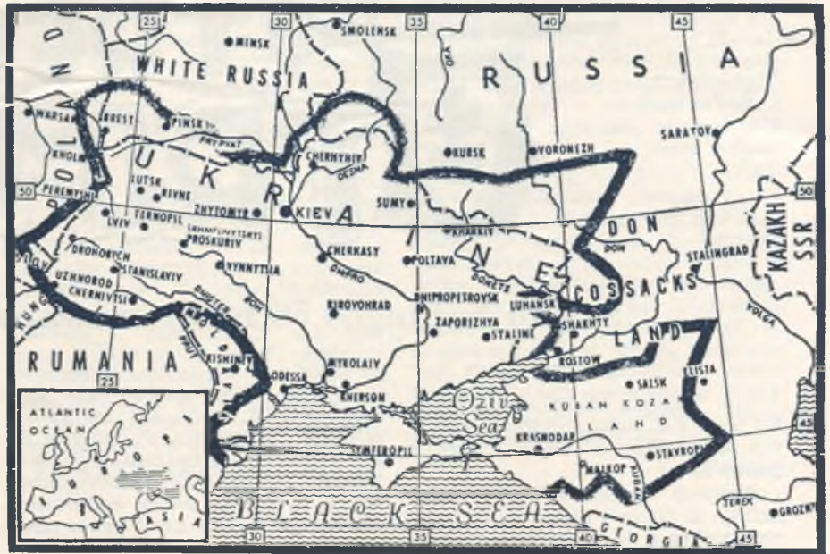
Ukrainiečių etnografinės sienos ("The Ukrainian Quarterly")

Lietuvos aneksijos nepripažinimas tikrai yra labai vertinga atrama mūsų kovai už laisvę, tačiau mūsų tai negali patenkinti, nes okupacija de facto egzistuoja, ji toleruojama ir nieko nedaroma jai pašalinti. Nepadaryta iš Valstybės Departamento pusės ta linkme jokių diplomatinių ėjimų ir neatrodo, kad tokių būtų galima tikėtis ir ateity. Kongreso 1959 m. nutarimas dėl Rusijos pavergtų tautų, jas išvardinant, yra didi moralinė atrama jų kovoje už laisvę, tačiau Valst. Departamentui, atrodo, buvo nemalonus faktas.