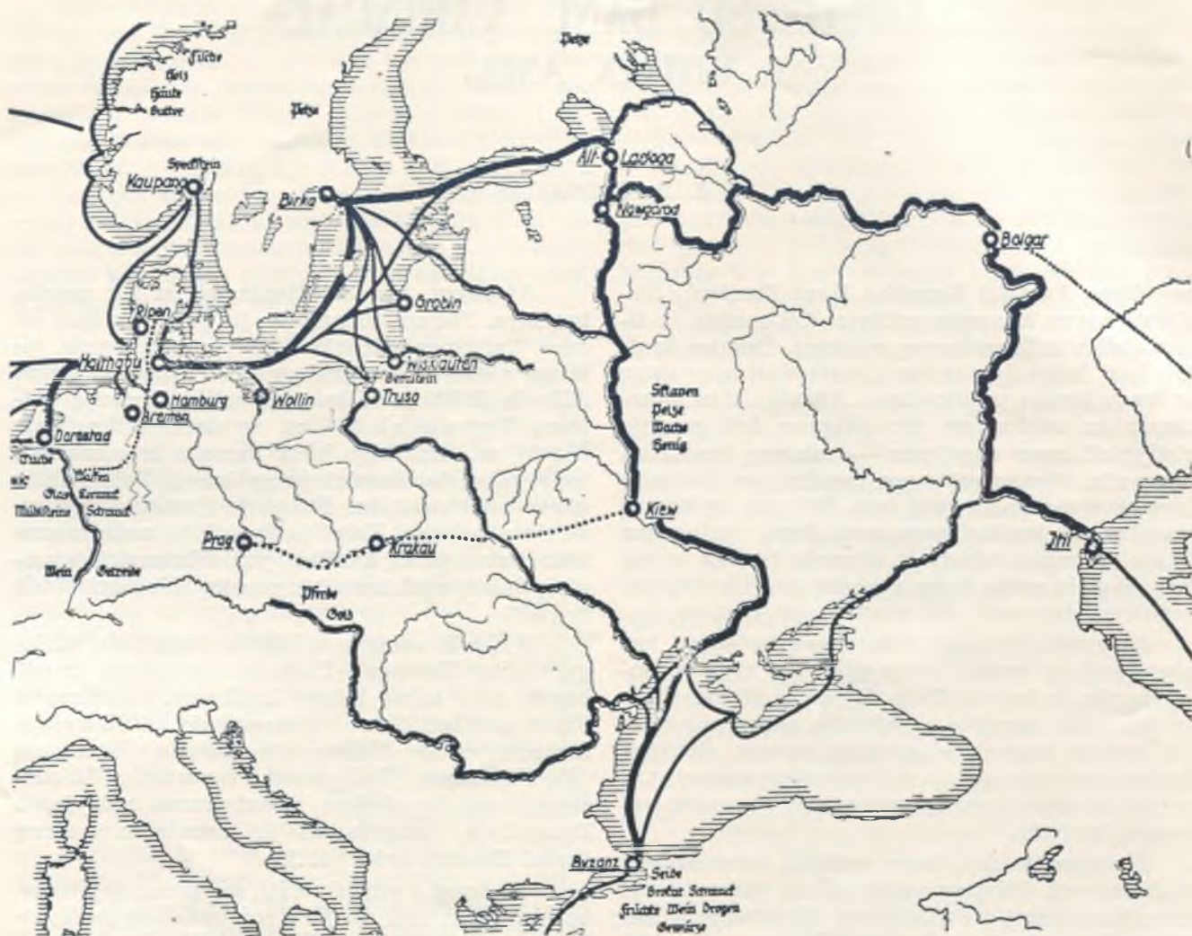
Pagrindiniai prekybos keliai šiaurinėje ir rytinėje Europoje, vikingų-vingių laikais (Iš vokiečių šaltinių.) Gintaro pakrantėje pažymėti trys miestai, prekybos centrai: Trusas, Viskiautai ir Gruobynas.

bek, Script. Rerum Danicarum I, 1772). Tuo tarpu, Annales Ryenses , rašyti iki 1288 m., tik trumpai nusako Hadingo žygius: “ Iste regem Sueciae et Hellespontem interfecit . . . M.G.H.S. val. 16 ).