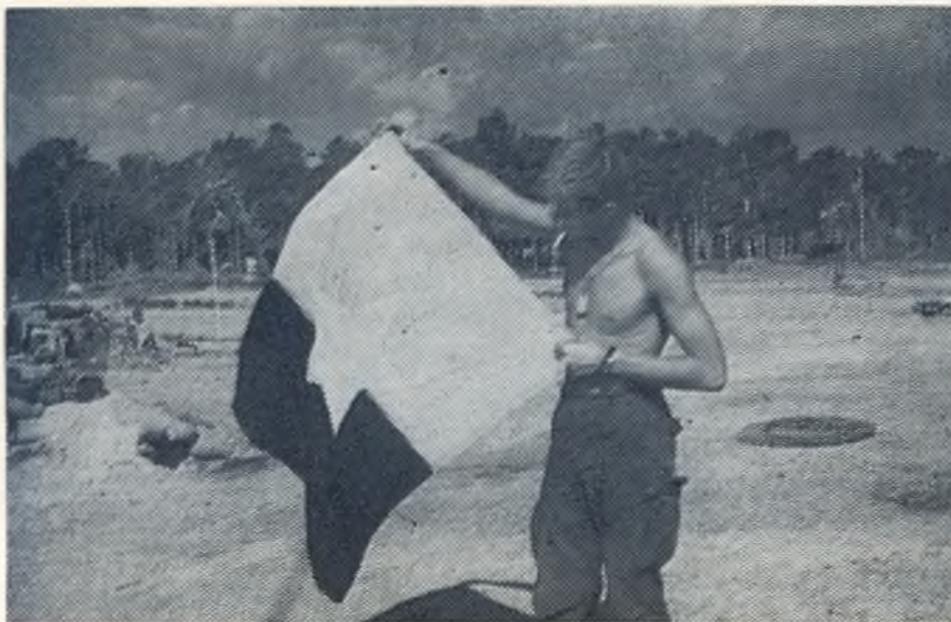
← Po kautynių, puolant vietkongiečiams mūsų perimetrą, paimta jų dalinio vėliava.