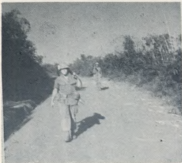
↑ Swamp Rats—Pelkių žiurkių patrulis saugoja kelią.

Dienos per daug čia nesikeičia net švenčių metu, visvien reikia eiti patruliuoti kelią, arba į džiuŋgles slapukais naktį tūnoti. Nors daug kalbama apie paliaubas švenčių metu — tuo, tačiau, niekas netiki, daugiau bijosi kokio vyliaus, kaip