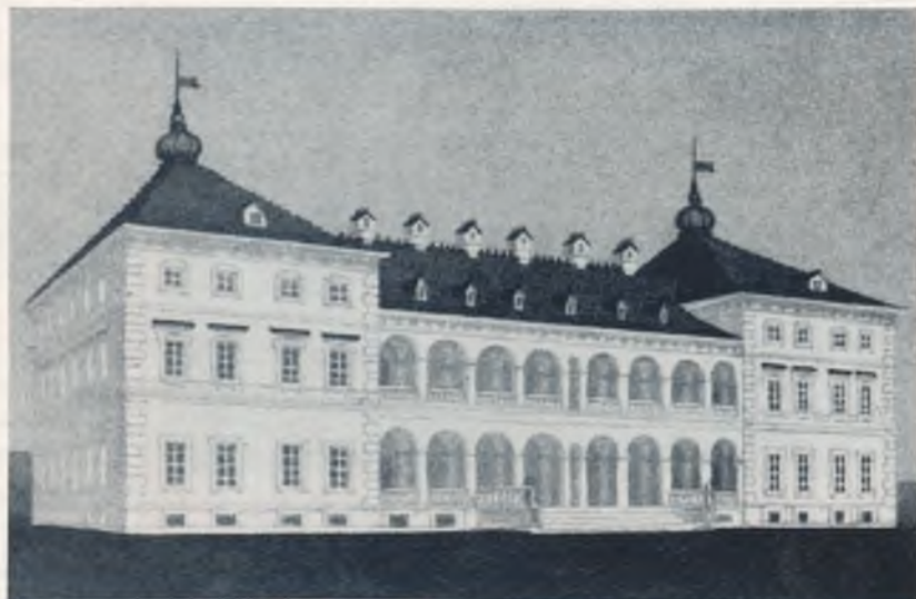
Radvilų rūmai 1701 m.