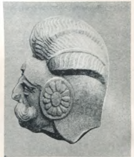
Kario galva, kalta iš smiltainio