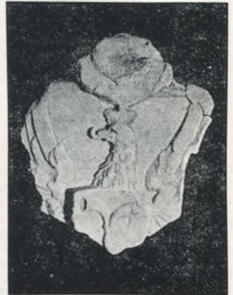
Radvilų herbino skydo fragmentas, kalta iš smiltainio