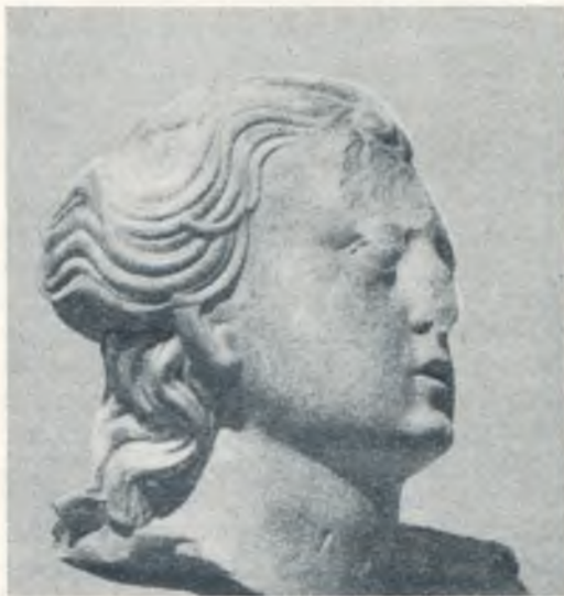
Moters galva, kalta iš smiltainio. Biusto fragmentas.