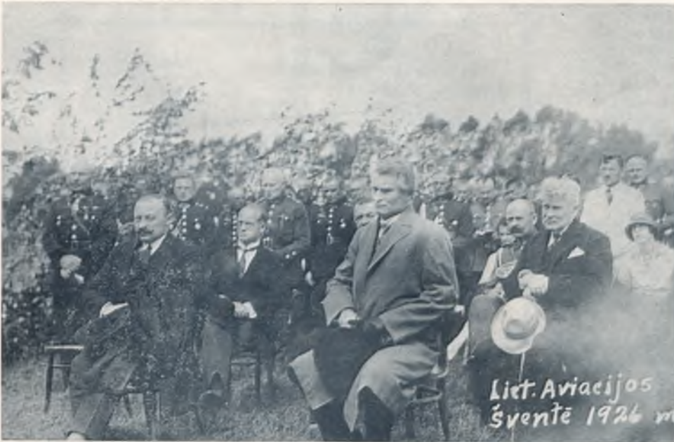
Prez. K. Grinius (viduryje—priekyje), vyriausybės narių tarpe, Lietuvos Aviacijos šventėje 1926 m.