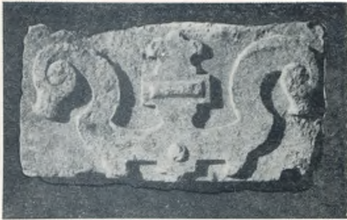
Ornamentuotas skydas, iškaltas iš gipso luito