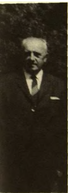
Zenonas Ivinskis 1965 metais Vokietijoje.