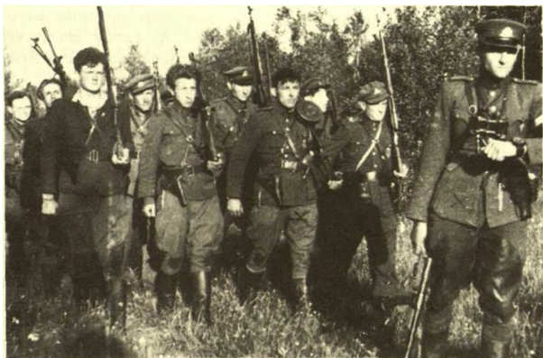
Prisik limo apygardos, Maironio rinktinės, Mindaugo t v nijos kovotoj už laisv — Lietuvos partizan b rys, veik s Raseini -Radviliškio ribose. Nuotrauka daryta 1949 m. spalio m n., iš negatyvo išryškinta 1992 metais. Visi nuotraukoje matomi partizanai žuv .

tuvos išlaisvinimu. Tuo tik jo ne vien partizanai, bet ir žmonės tik jo. Nuo vasaros iki vasaros atidavo. Ir štai, kai 1947 ruden Vakarais iš jo Skirmantas, prasidėjo didysis laukimas — k Skirmantas ten laimės? 1948 metais labai daug žmonių buvo, labai daug vadų žuvo, išdavysiai atsirado, užmigdyti buvo. 1948 žuvo trys „Geležinio vilko“ rinktinės vadai.