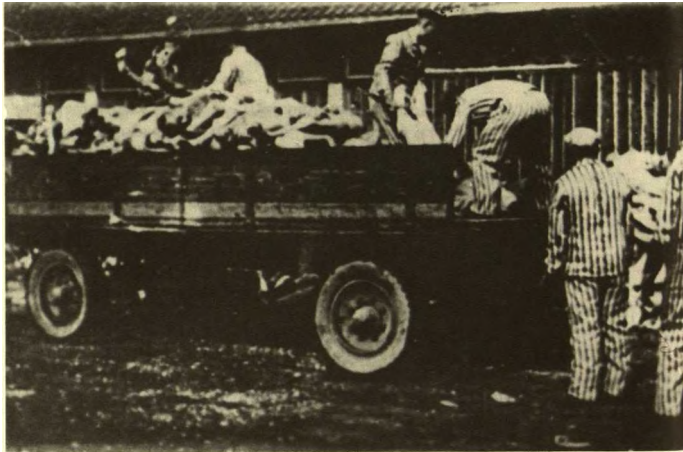
Vaizdelis iš mirusių „laidotuvių“ Stutthofo kacetė.