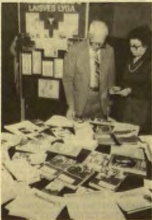
Prie Baltų Laisvės lygos paruošto informacinės literatūros stalo

5. Globaliniu mastu veikiančių organizacijų centrai neturėtų savo vardu vykdyti veiklos atskiruose kraštuose, kur jau veikia organizuotos lietuvių bendruomenės. Tai iššaukia nesusipratimus ir nesantaiką. Centrinės organizacijos turėtų būti idėjų pasiūlytojos, projektų kūrėjos, veiklos skatintojos ir koordinatorės. Tiesioginiai atskiruose kraštuose jos veikia tik ten, kur stipriau organizuoto lietuviško gyvenimo nėra arba kur bendruomenės taip silpnos, kad pačios vienos jaučiasi bejėgės.