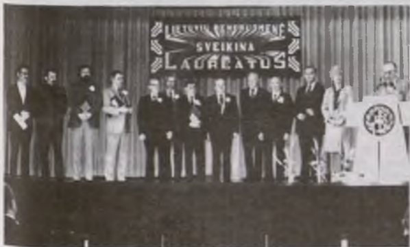
Apdovanojami laureatai JAV Lietuvių Bendruomenės 30-mečio sukakties minėjime, įvykusiame 1982 m. balandžio 16-18 Detroitė.