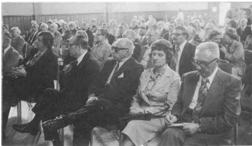
Politini studij savaitgalio dalyviai

Pozityvi pasi lym padar Vencien , inga, Paškevi ius, Tamošaitis: apylinki pirmininkams suteikti tarybos nario teises, iš kandidat taryb reikalauti tam tikr kvalifikacij , "LKB Kronikas" ir pogrindin "Aušr " skubiau išleisti svetimomis kalbomis, rinkti ir leisti dokumentin medžiag apie lietuvi tautos patirtas skriaudas okupacijose, paruošti lituanistini mokykl programas nemokantiems lietuviškai, didesn solidarumo mokes io nušimt skirti aukštesniosioms LB institucijoms, suteikti daugiau teisi